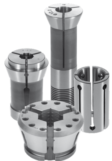
Ein Spannstock – vier Spannarten

Der manuelle Spannstock Typ MZ ist verfügbar für Spannköpfe Typ SK 65, für Druckspannzangen 163 E und 173 E, für Zugspannzangen 364 E und 3713 E sowie für Spannhülsen Typ S03, S04 und S05. Weitere Größen sind auf Anfrage lieferbar, sprechen Sie mit uns über Ihre Anforderungen.